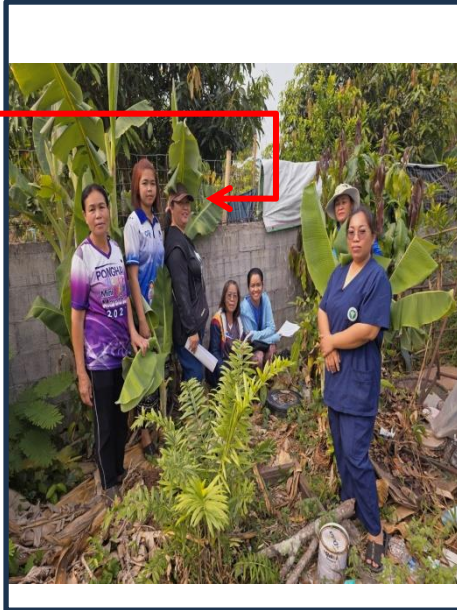
เจ้าของบ้าน