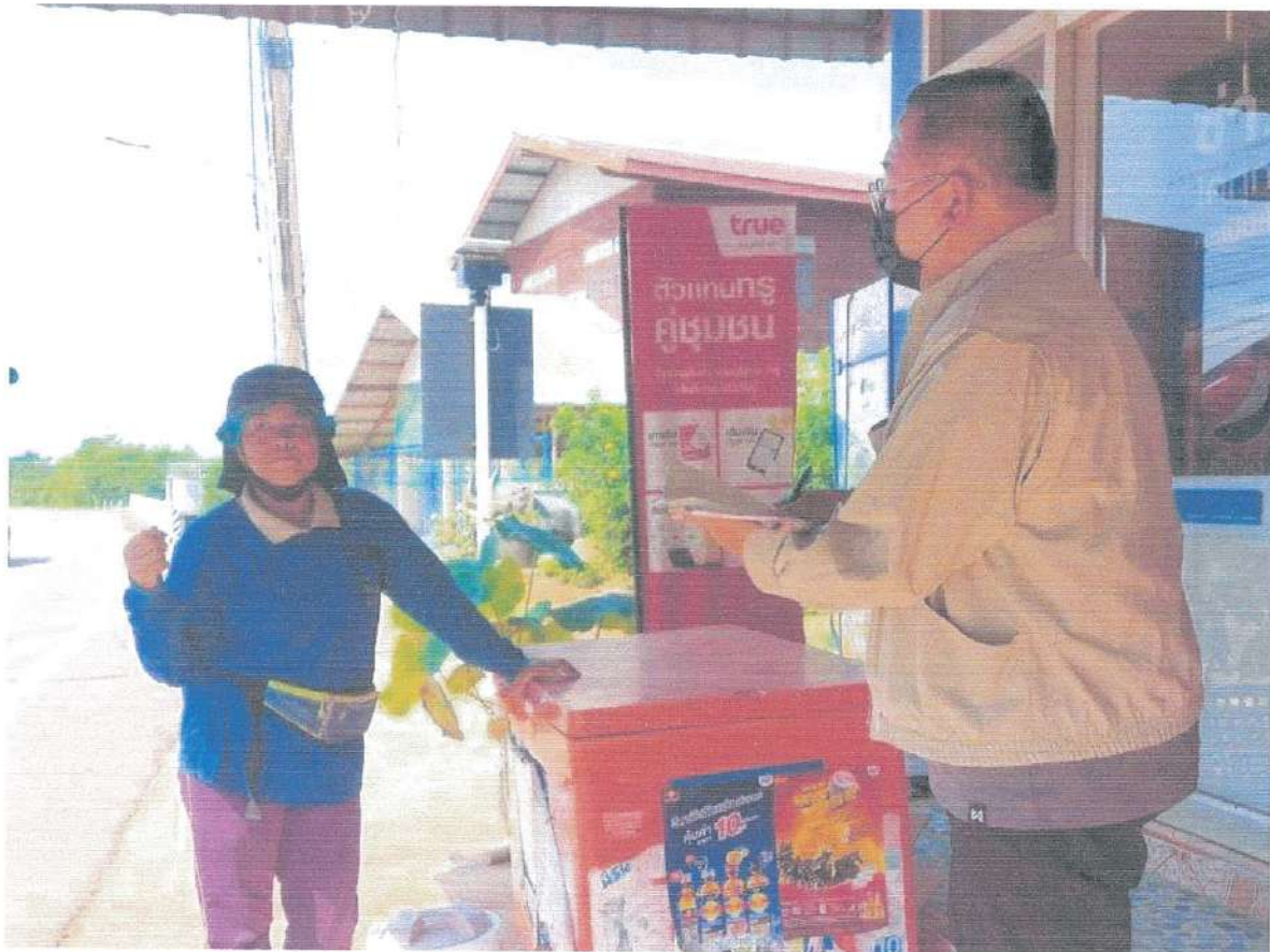
ภาพที่ 4.4 ทีมงานนักวิจัยลงพื้นที่แจกแบบสอบถามในเขตเทศบาลตำบลปงไฮ อำเภอลำดวน (4)