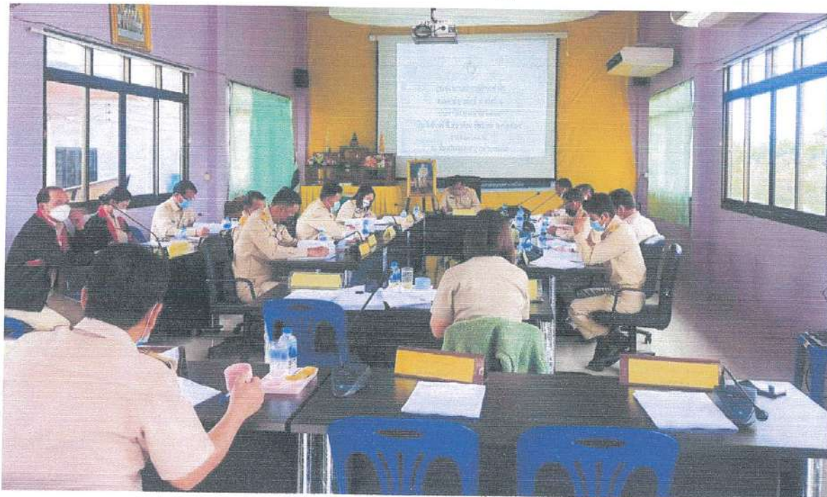
ภาพที่ 5.2 ทีมงานนักวิจัยลงพื้นที่แจกแบบสอบถามในเขตเทศบาลตำบลป่งไฮ อำเภอลำทะเมนชัย (2)