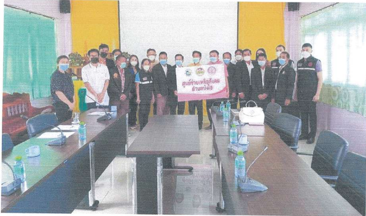
ภาพที่ 4.1 กิจกรรม/โครงการของเทศบาลตำบลป่งไฮ อำเภอลำทะเมนชัย (1)

สุดท้าย ด้านการทำแบบสำรวจและประเมินความพึงพอใจในการให้บริการขององค์กรปกครองส่วนท้องถิ่น พบว่า กลุ่มตัวอย่างทั้งหมดไม่เคยทำแบบสอบถามประเมินความพึงพอใจการให้บริการขององค์กรปกครองส่วนท้องถิ่น ร้อยละ 100 รายละเอียดตามตารางที่ 4.1